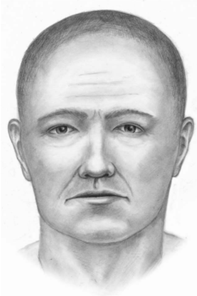
Рис. 2. Графическая реконструкция по черепу мужчины 30–40 лет из погребения 4, анфас. Автор – А.В. Рассказова